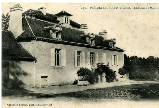
Entrée principale façade Ouest XVIII e siècle