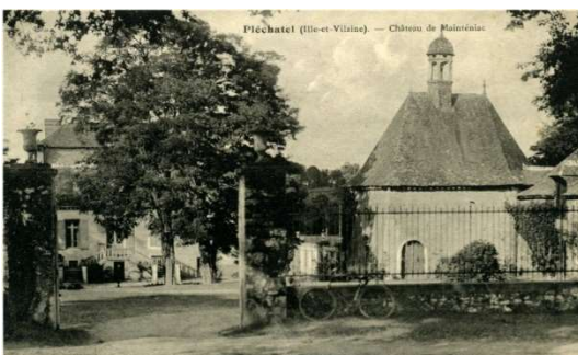
La chapelle St-Sauveur construite en 1670