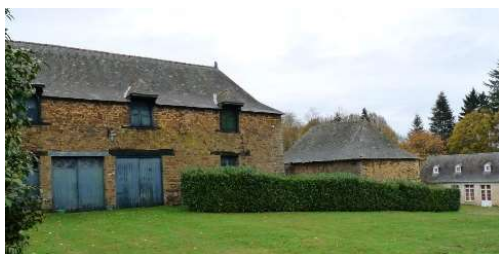
Anciennes écuries et cellier de la propriété