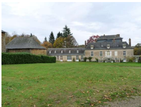
Entrée principale façade Ouest

La propriété de Mainténiac est privée et habitée. L'entrée est interdite