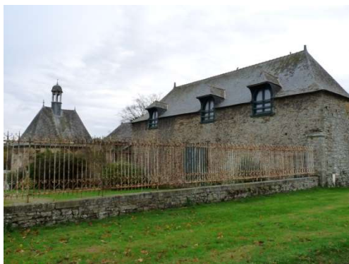
Ancienne remise et chapelle St-Sauveur