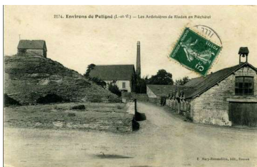
Carte ancienne

Ouvertes au 18 e siècle ce n'est qu'au cours du 19 e que les carrières se développèrent.