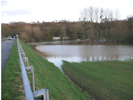
La Plage - 2008