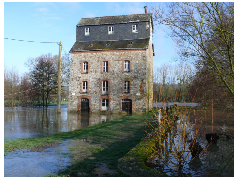
Quenouard - 2009