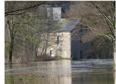
L'Ardouais - 2009