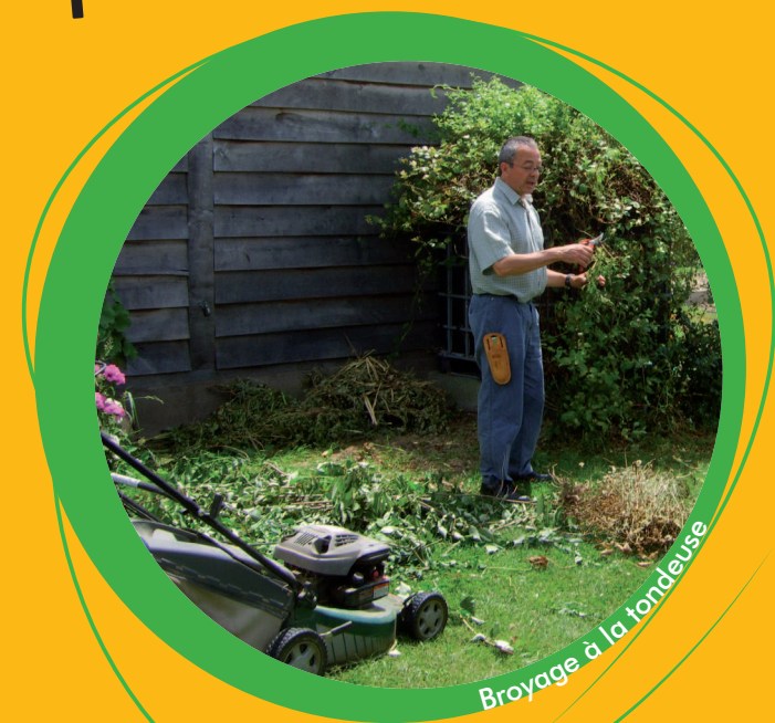
Broyage à la tondeuse

www.paysdesvallonsdevilaine.fr www.smictom-nar.fr